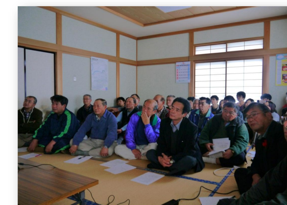
11月調査報告会&交流会の様子