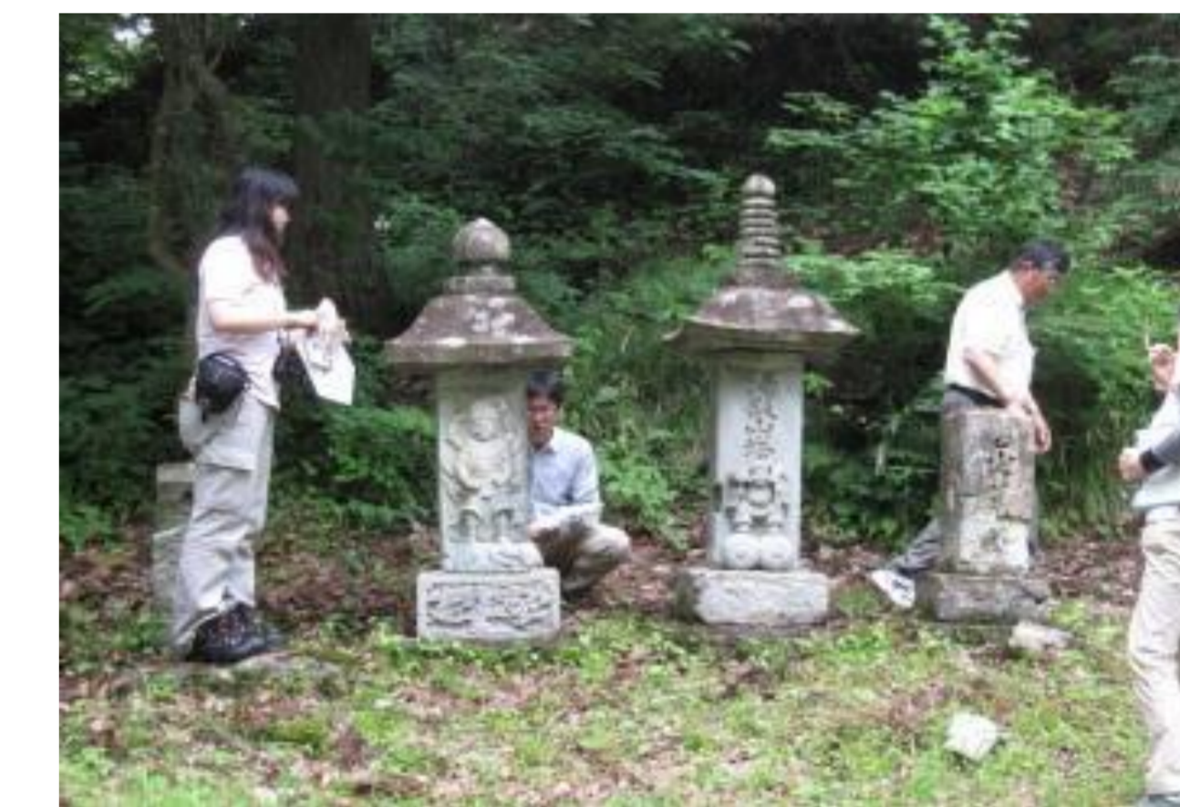
集落のお宝調査の様子