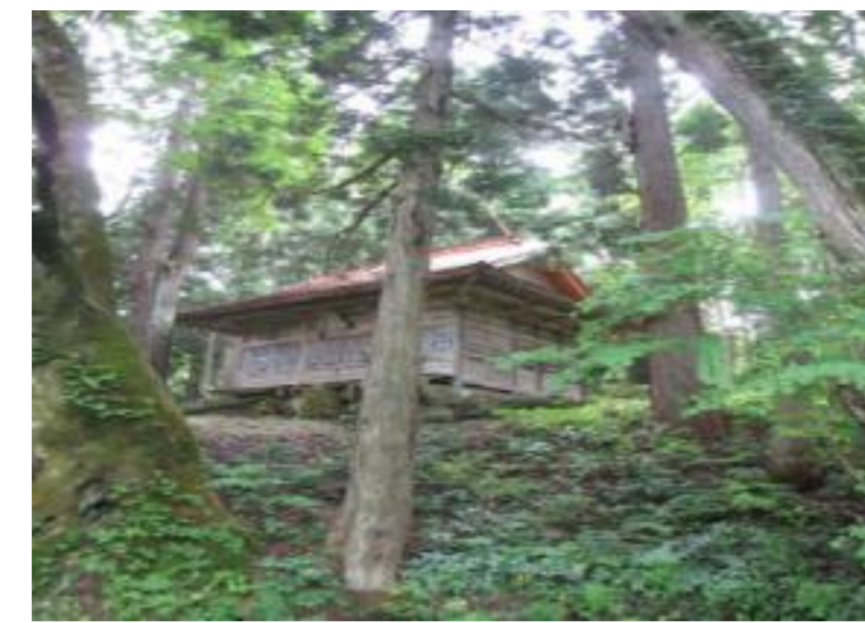
集落のシンボル・大清水