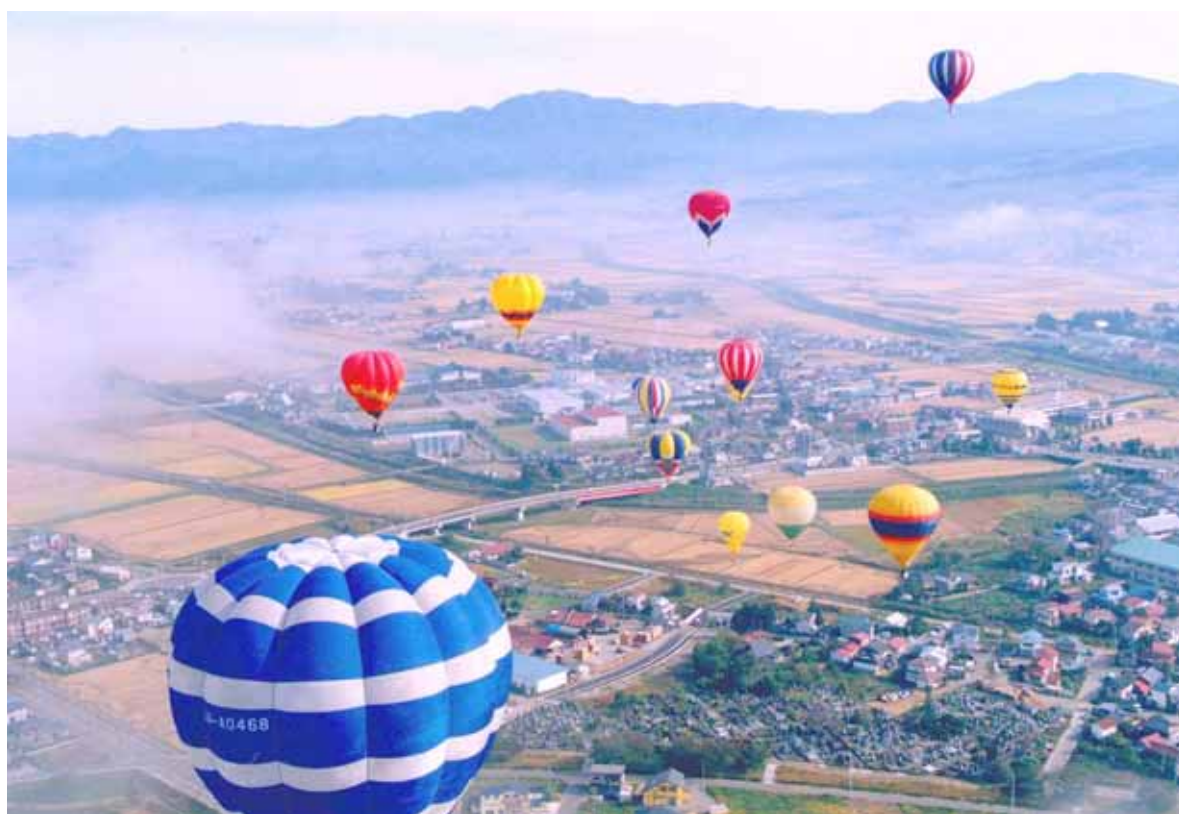
会津塩川バルーンフェスティバル