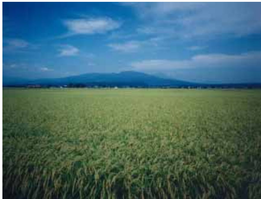
湯川村の田園風景（奥は磐梯山）