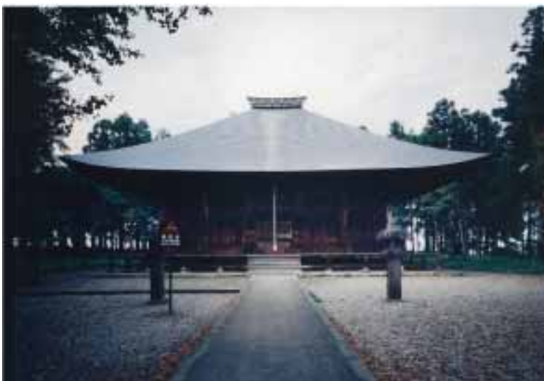
勝常寺薬師堂（国重要文化財）