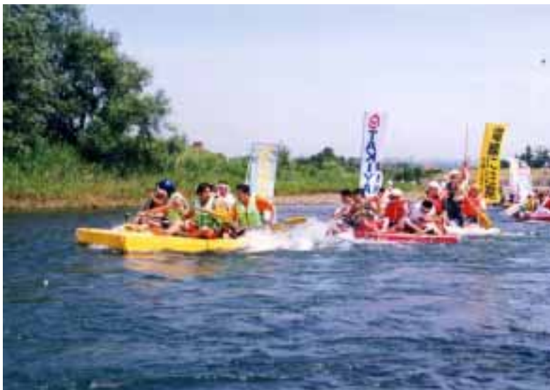
川の祭典（いかだ下り）

仏教文化の遺産や阿賀川の舟運の起点、米沢街道の中継地として栄えてきた歴史など、塩川町、湯川村の個性を生かしたまちづくり