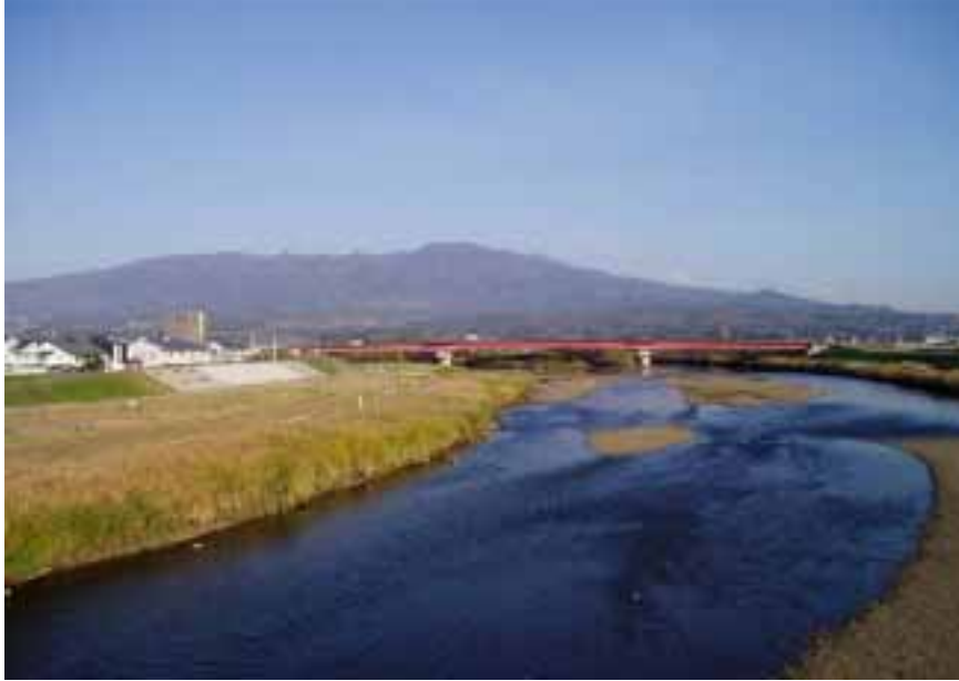
塩川町と湯川村を分ける日橋川