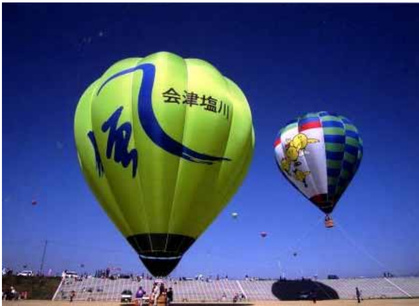
会津塩川バルーンフェスタ

湯川村には、木造薬師如来と両脇侍像（日光・月光菩薩像）の三尊が国宝に指定されている勝常寺があり、東北を代表する名刹といっても過言ではなく、磐梯町の恵日寺とともに会津仏教文化の双壁をなしてきた寺であることから、歴史的遺産として次世代への文化の伝承を図っていく。