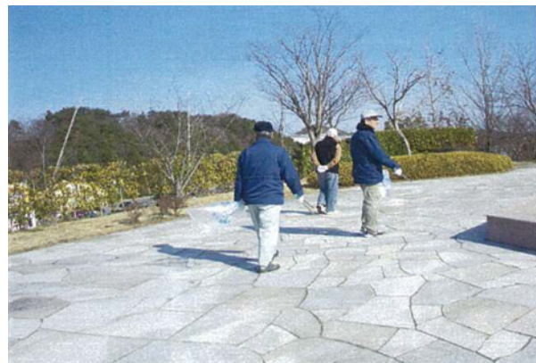
サポーターの活動例 公園パトロール