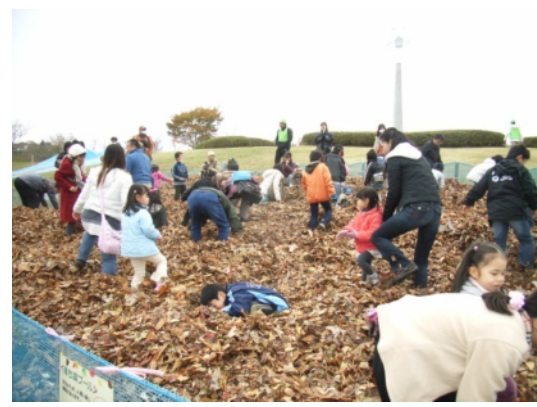
サポーターの活動例 公園内のイベント開催