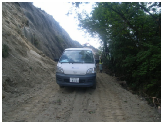
写真：車搬出の様子 自走していくことができました。

平成23年3月11日(金)の東日本大震災により、県道白河羽鳥線の被災箇所に取り残されていた車2台が、平成23年9月10日(土)に工事現場外へ搬出することができ、無事、所有者の元に戻りました。