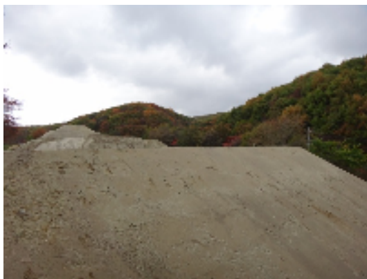
写真：平和観光開発(株)さん所有地 盛り土状況

現場は、狭い中での難工事ですが、一日でも早く供用できるよう、みなさんと一緒にガンバッテいます。