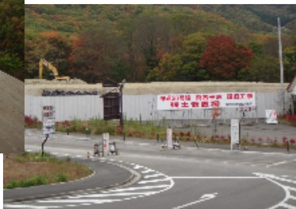
写真：東京建物(株)さん所有地 盛り土状況

工事用車両の通行のため、近隣を通行する方々には、ご不便・ご迷惑をおかけしますが、ご理解、ご協力をお願いいたします。