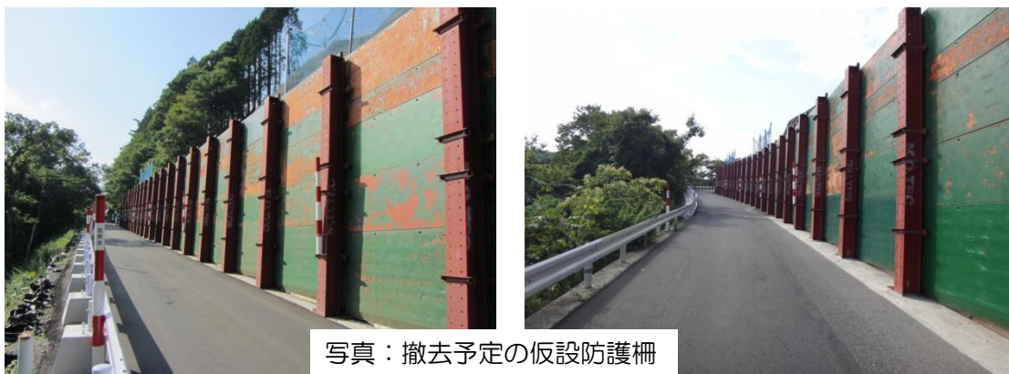
写真：撤去予定の仮設防護柵