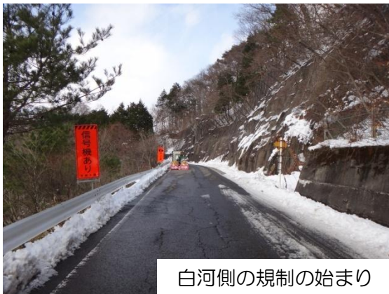
白河側の規制の始まり

今後も、復旧完了(平成25年7月末予定)まで、ご不便・ご迷惑をおかけしますが、ご理解、ご協力をお願いいたします。