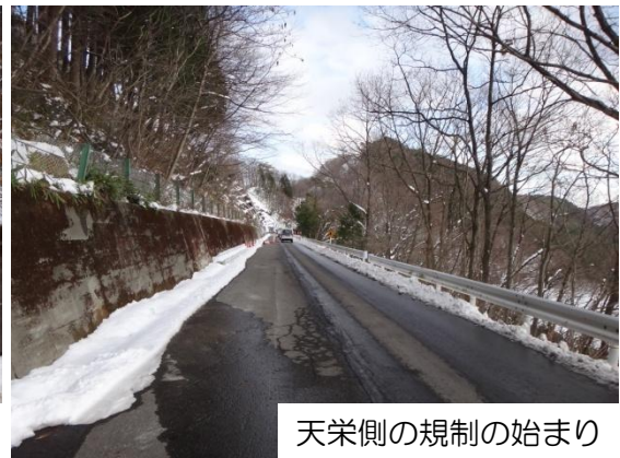
天栄側の規制の始まり