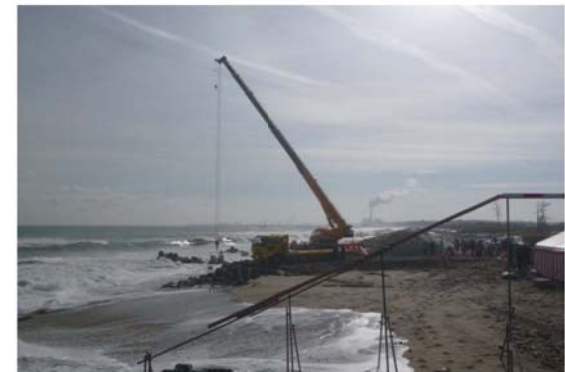
ブロック据付状況