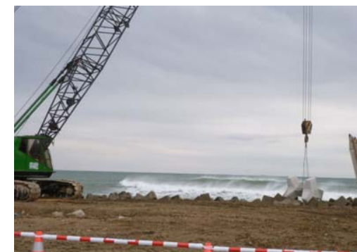
ブロック据付状況