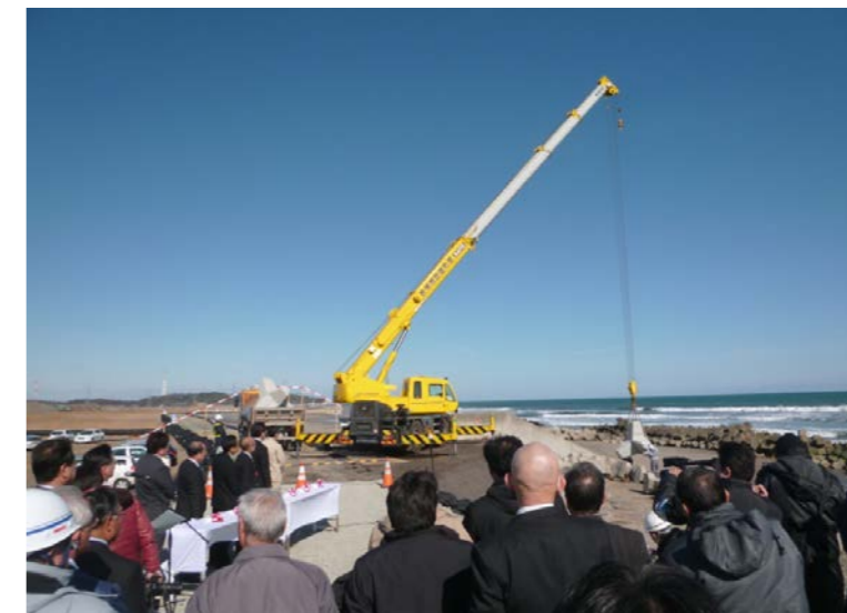
ブロック据付状況