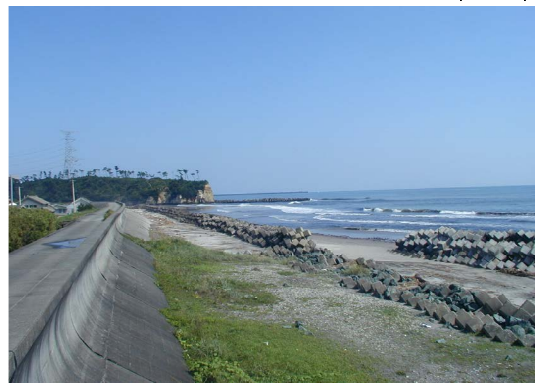
震災前の洪佐萱浜地区海岸