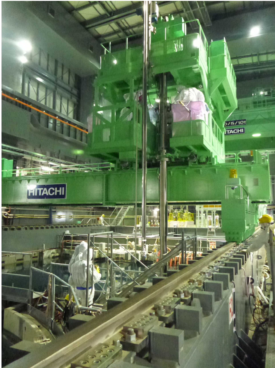
2 燃料取扱機の遠景