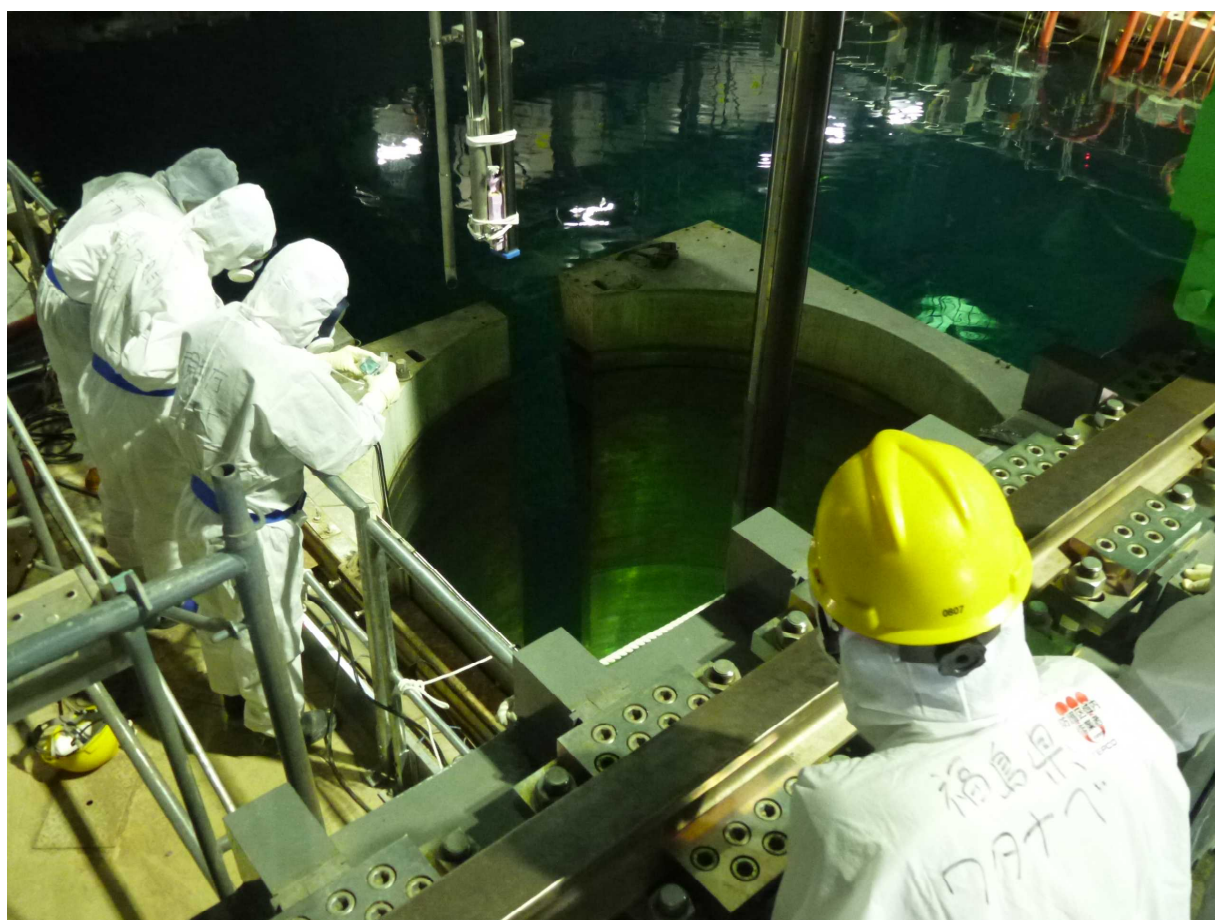
1 キャスクに燃料集合体を装填している状況