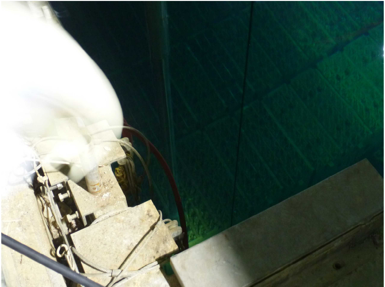
4 燃料をつかむ状況