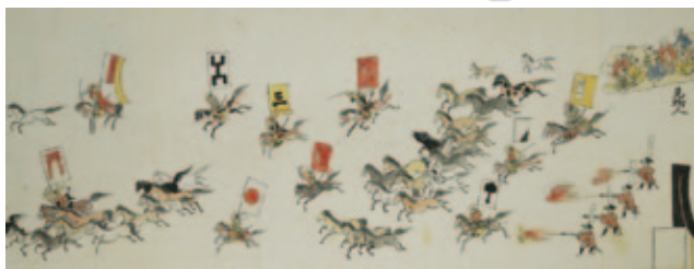
江戸時代の相馬野馬追のようす(「野馬追絵巻」相馬市教育委員会蔵)