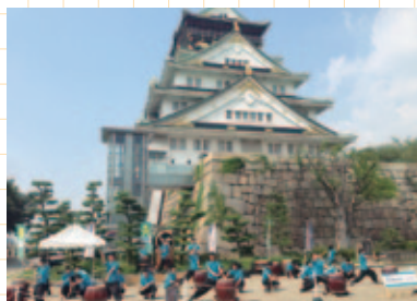
ふくしま復興PR演奏 大阪城公園天守閣前にて

復興に貢献したいという願いを実現する機会を、子どもたち自身が中心となって計画・実践します。復興に役立つ社会体験や社会貢献活動等に参加することで、子どもたちがたくましく成長し、新生ふくしまを担う人材となることを目的としています。