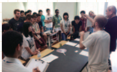
福島高生とフランスの高校生との放射線学習

日本を代表する観光名所や世界遺産で奉納演奏できたことは、一生忘れられない素晴らしい経験になりました。これからも演奏を通じて、福島の高校生の元気と感謝の気持ちを伝えていきたいと思ひます。