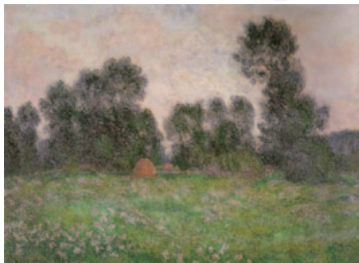
クロード・モネ(ジヴェルニーの草原)