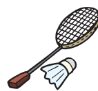
バドミントン男子ダブルス優勝 渡辺勇大選手・三橋健也選手 (富岡・ふたば未来学園高校)