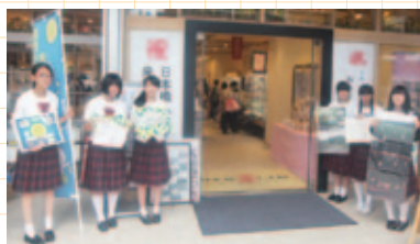
広報キャラバン隊 日本橋ふくしま館MIDETTEにて

フランスの生徒との交流により、震災や原発事故による農作物の風評被害や被災地域の様々な課題を知りました。私たちは福島の現状を理解し、正しい情報や知識を身に付けて、海外も含め積極的に発信していかなければと強く思いました。