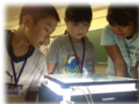
【霧箱による放射線の飛跡の観察（放射線の可視化）】