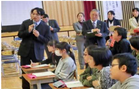
保護者との連携 先進校視察