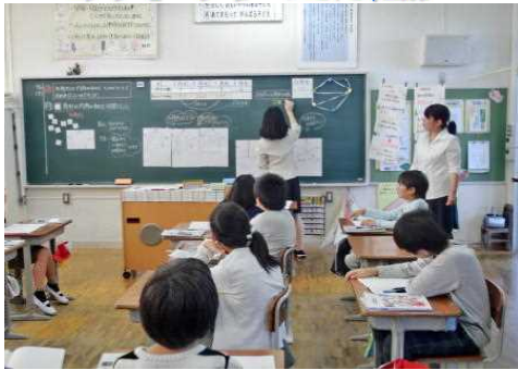
幼・小・中・保護者連携 師範授業