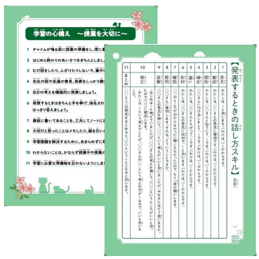
「学びの手引き」をクリアファイルに