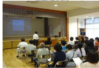
先進校からの取り組み 自学ノート