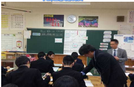
秋田県東成瀬村小・中学校へ