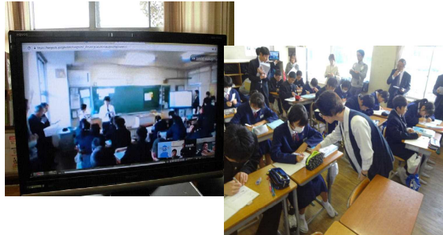
幼・小・中・保護者連携 教育講演会