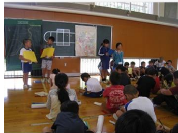
【合同社会科：発表会の様子】