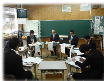
【小学校：中学校英語教師とのTTによる外国語活動の授業と研究会の様子】