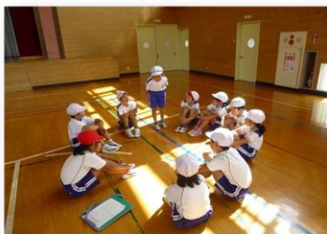
【合同生活科：学校探検】