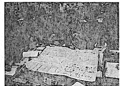
中学生交流学習活動の様子

各分科会の指導助言者を派遣するなど、PTA活動の運営等について支援を行うとともに、PTA主催の中学生交流学習活動への参加を通し、支援体制の構築に努めた。