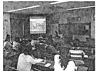
家庭教育支援者 スキルアップセミナーの様子