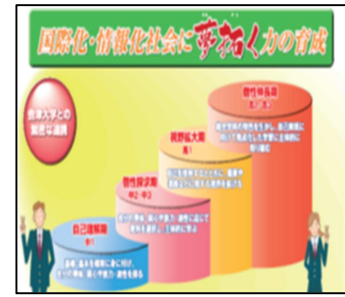
併設型中高一貫校のイメージ