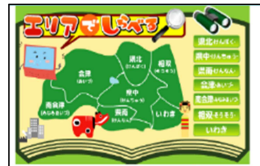
うつくしま電子辞典