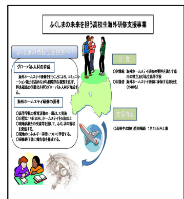
高校生海外研修支援事業

また、学校が実施するホームステイ研修に参加し、本県の現状を世界に発信する高校生を対象に旅費の一部を支援しています。※平成25年度対象者数 9校202名