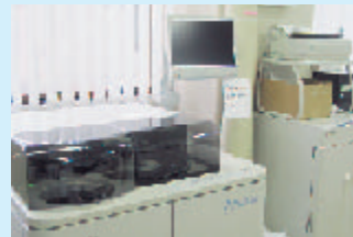
● 生化学自動分析装置

一方、心電図・脳波・眼底・呼吸機能検査などの生理学的検査は、先にも述べましたように血液や生化学検査の様に検査材料を分析するものとは違い、患者様自身に直接検査を行うものであるため、検査行為には十分な配慮が必要です。当院は精神科病院ということからも脳波検査が多く、生理学検査をするに当たっては「検査室の基本的態度」の一つでもある、患者様にわかりやすい言葉で検査の内容を説明し、意志を尊重し、患者様とのコミュニケーションを大切にしながら“心の通い合う検査”を行うことができるよう日々業務に取り組んでおります。