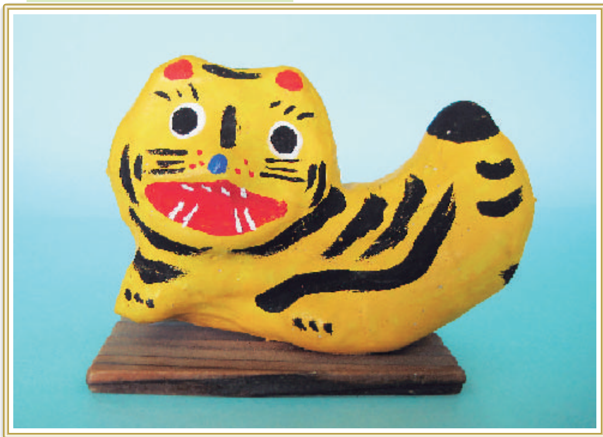
[写真] 矢吹の張り子(寅) 患者様のリハビリの一環として、 また療養の糧及び地域に根ざした活動として、 当院では毎年張り子でオリジナルの干支を 製作しています。