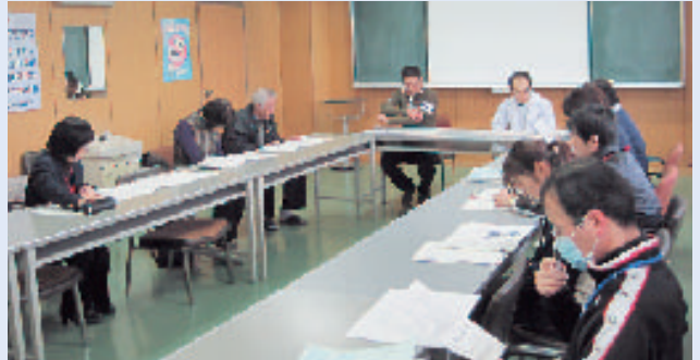
● 地域生活移行支援に関する会議

この事業の良い点は、ワーキンググループ会議に参加された方々とのネットワークが形成されたこと、当院