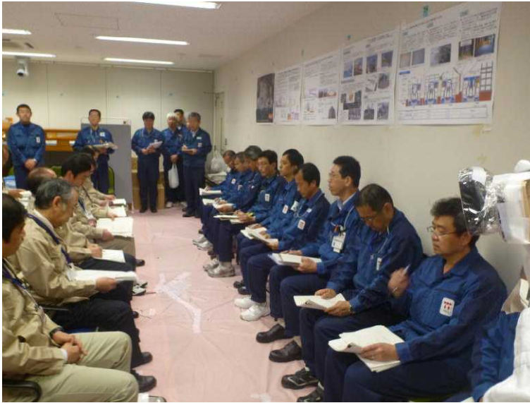
○東京電力による説明 (免震重要棟)