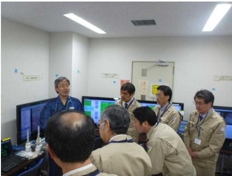
○ALPS 操作画面 誤操作に対する対応状況