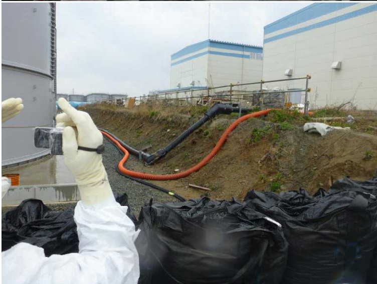
○地下貯水槽から H2タンクへの移送ライン