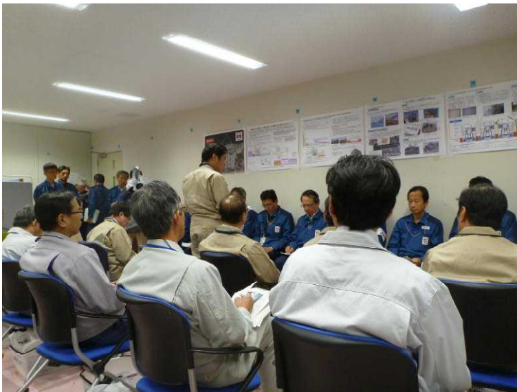
○原子力安全対策課長による挨拶 (免震重要棟)