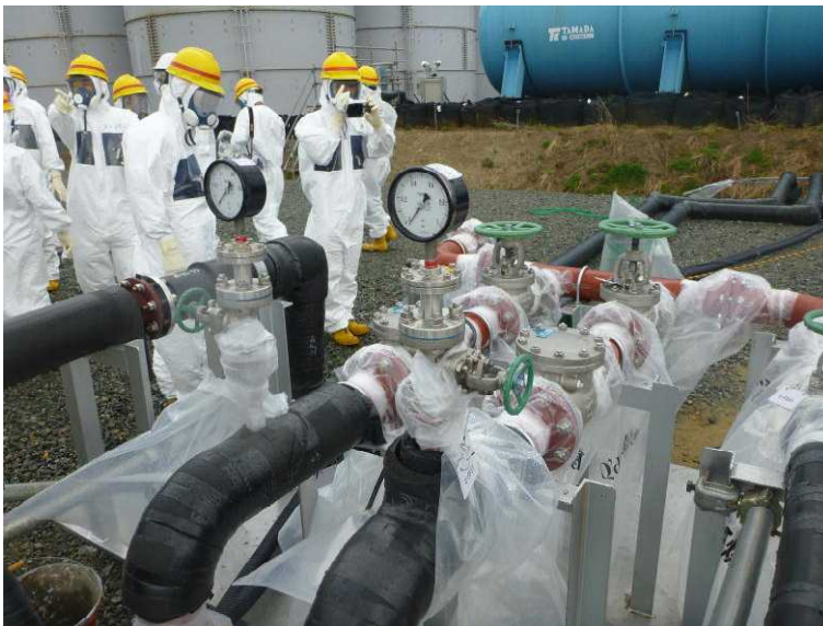
○地下貯水槽からの移送 ラインのフランジ部