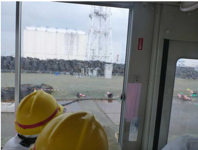
○地下水バイパス揚水井 （写真中央）