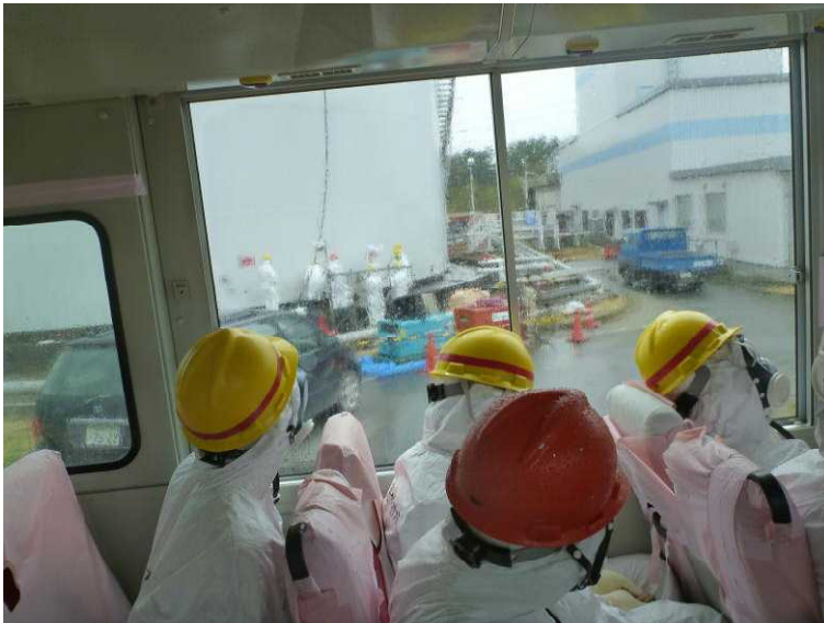
○ろ過水タンクへの移送 ライン工事の作業状況