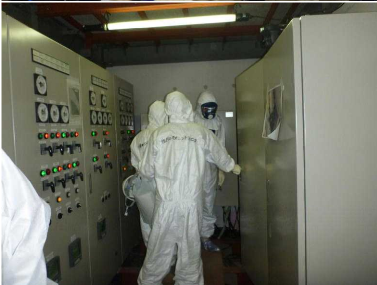
○3号機使用済燃料プール 循環冷却設備制御盤