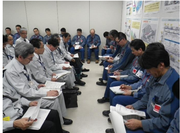
危機管理部長から東京電力への申し入れを実施