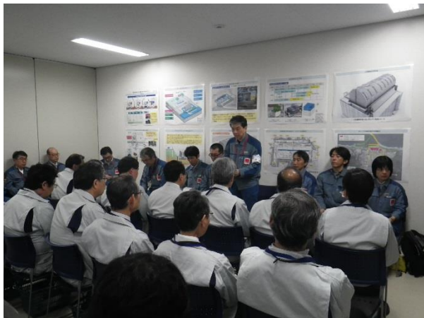
廃炉安全監視協議会閉会にあたり、福島第一原子力発電所長からの挨拶