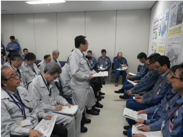
廃炉安全監視協議会開催にあたり、危機管理部長からの挨拶