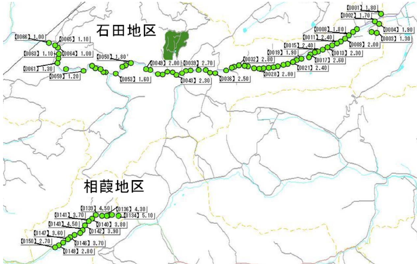
環境放射線モニタリング詳細調査（伊達市）道路調査位置図