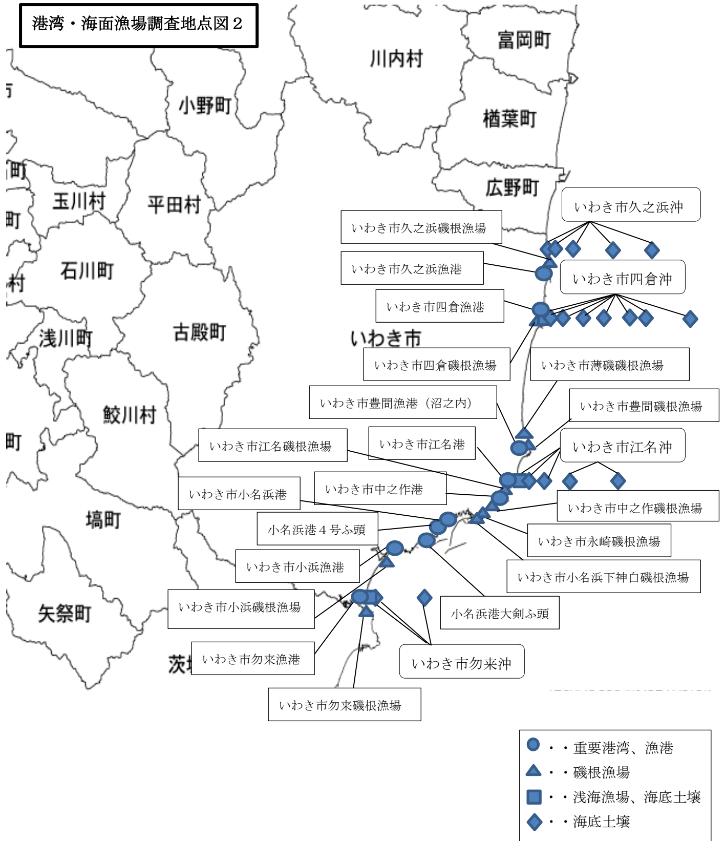
港湾・海面漁場調査地点図 2