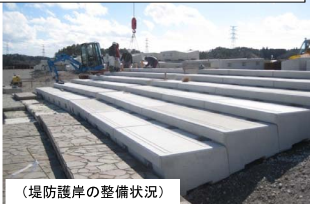
(堤防護岸の整備状況)