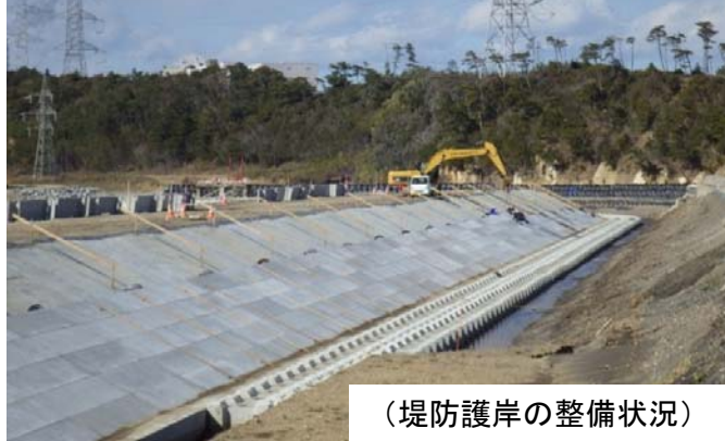
(堤防護岸の整備状況)