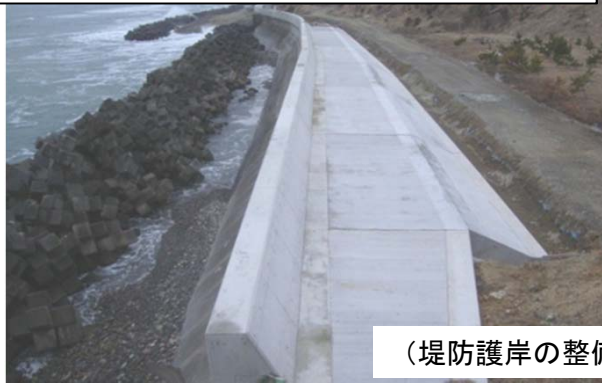
(堤防護岸の整備状況)