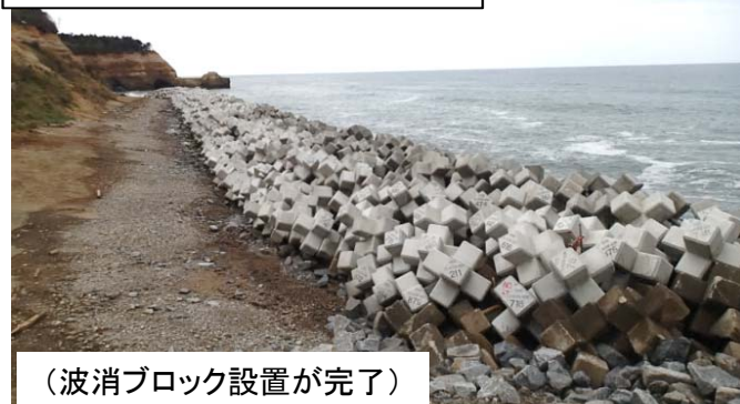
(波消ブロック設置が完了)