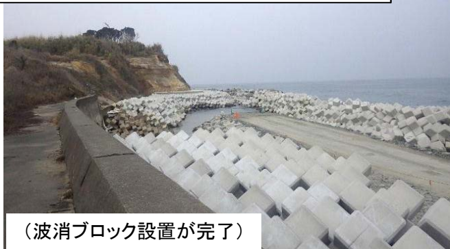
(波消ブロック設置が完了)