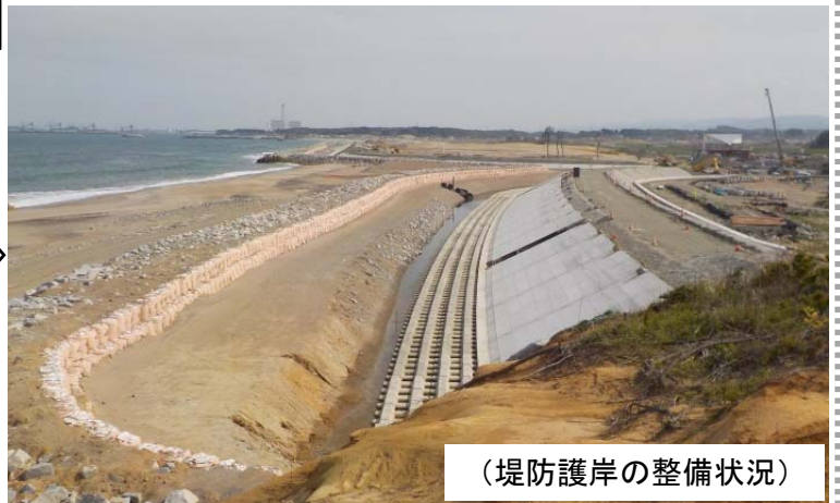
(堤防護岸の整備状況)