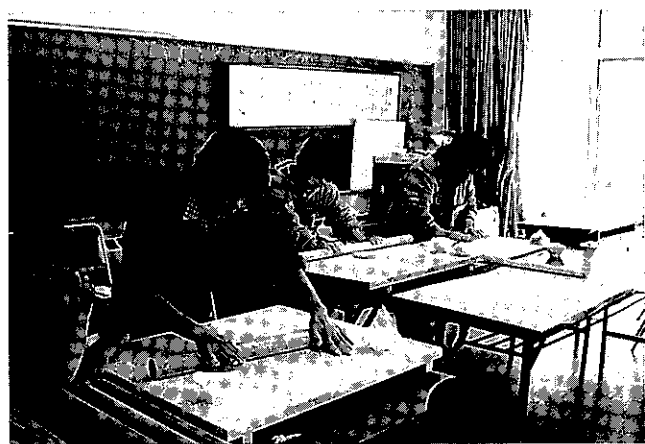
自分で食べるそばを打つので皆真剣です

今回で、今年度企画した計4回のモニターツアーが全て終了しました。このモニターツアーの実施結果をふまえ、3月11日には参加スタッフ・インストラクター等を集め、今年度の反省を来年度に生かすための実績検討会を開催しました。