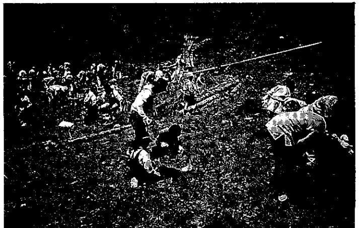
親子緑の教室 コナラの植林

今後、読者の意見交換の場としての役割も持たせたいと考えておりますので、感想、ご意見等をお寄せいただければ幸いです。