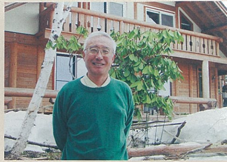
自宅のログハウスの前にて

そもそも横浜市出身である長原さんがIターン者として南会津に移り住んだのは、まず奥様が新聞の