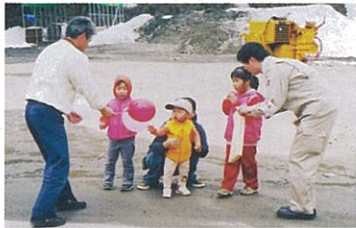
山火事防止をお願いします!

パレードは広域消防本部、会津森林管理署、会津森林管理署南会津支署、町村、森林組合、東北電力、電源開発、南会津地方振興局及び南会津農林事務所の職員等が、山火事防止標語入り花の種や携帯灰皿を配りながら山火事予防を呼びかけました。