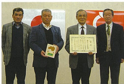
藤生わらび生産組合の皆さん

平成7年から藤生地区の住民が一体となって取り組んできた共有地「鉾山」での観光わらび山の運営のほか、遊休農地を活用した「アクの弱