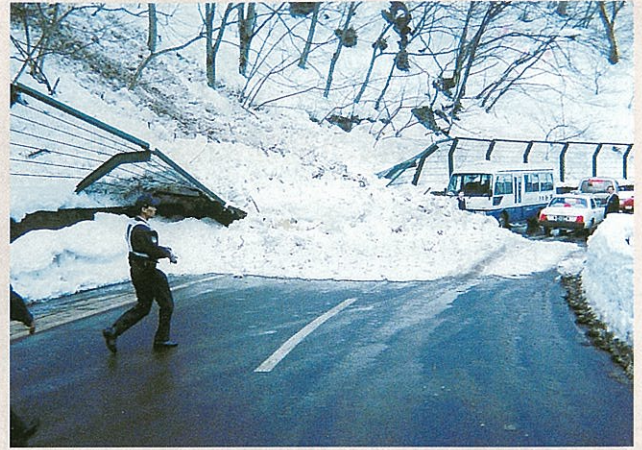
下郷町(湯野上) 平成16年2月14日 なだれ発生