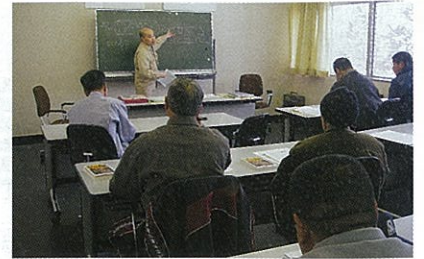
熱心に聞き入る参加者

今回の参加者のうち数名は今年からムラサキシメジやサケツバタケといったきのこの栽培試験にも新たに取り組むことになっています。今後は、伊南きのこセンターの高度活用も視野に入れ、南会津の自然環境を活かしたきのこの生産振興を支援していきたいと思えます。