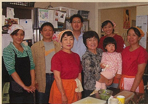
郷土料理レストラン厨房にて

昔は冠婚葬祭に出す料理は決まっており、代々受け継がれましたが、生活様式の変化などにより、郷土料理を学ぶ機会が激減していることから、料理教室にも力を入れています。公民館等で料理教室の講師をしていた町内の料理研究家は既に90