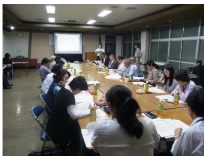
↑懇談会の様子です。