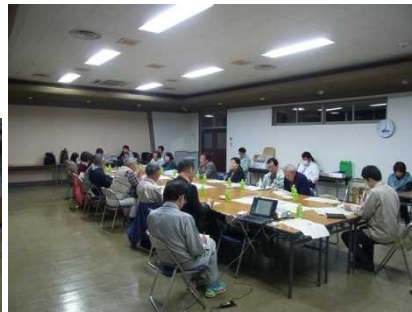
↑← 懇談会の様子です。