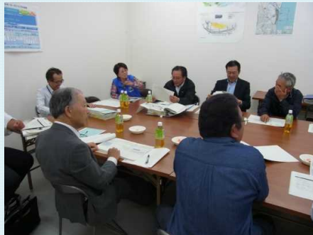
管理・利活用部会