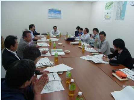
植樹祭実行準備部会

「植樹祭実行準備部会」が10月8日から、「管理・利活用部会」が10月15日から始まりました。サポーターズクラブの有志がそれぞれ集まり、各部会とも2週間に1回の開催スケジュールとなっています。活発な協議のもと決定・承認事項については懇談会で報告し、最終承認して頂きます。