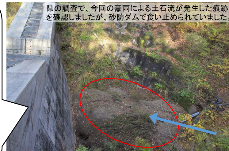
松原上沢砂防ダム堆砂区域

また、地域みんなで下流域を川普請する際にも土砂上げの苦労が無くなり、土砂が堰き止められていることを実感し、地域みんなで喜んでいます。