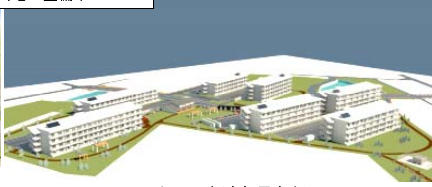
上町団地(南相馬市内)