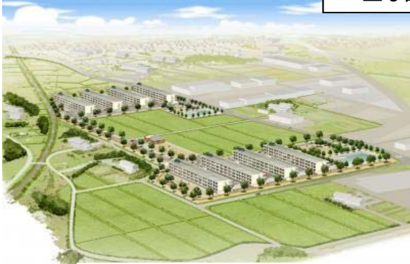
北原団地(南相馬市内)