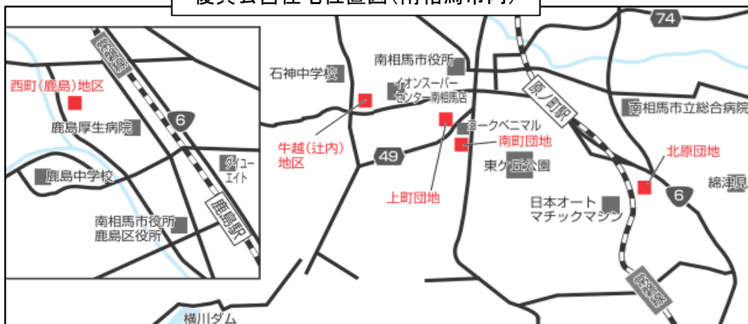
復興公営住宅位置図(南相馬市内)