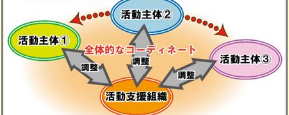
【活動支援組織の役割】