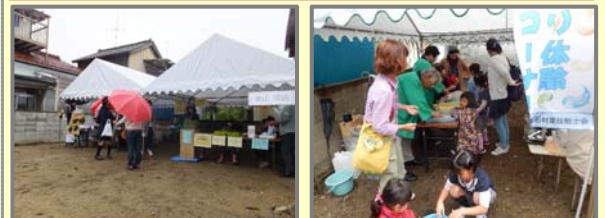
【短期的に実施する回遊促進方策のイメージ】