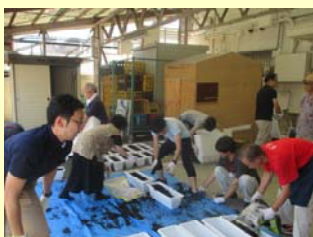
【プランターづくり】