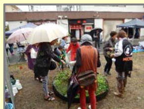
【短期的に実施する景観意識啓発方のイメージ】