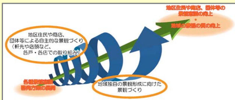
【小名浜の風景をより良くしていくための手順】