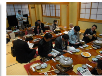
▲懇談会・懇親会の様子