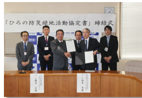
▲「清水建設株式会社東北支店」と活動協定を締結