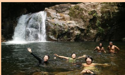
スリランカで初めて見た滝！ひんやりしていて気持ち良い！