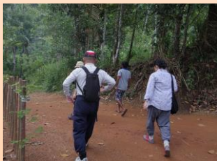
いよいよ、出発！ガイドと一緒に山道を歩きます。

週末の休みを利用して私の任地から北に50km、シンハラージャに行ってきました。同じマータラ県ですが、山道を越えるとき綺麗な茶畑が広がっており、涼しく過ごしやすい気候でした。シンハラージャは珍しい爬虫類や滝が有名です。写真がとれませんでした。サル、野鳥など沢山いました。