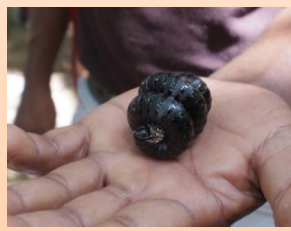
こんなに大きいダングムシを発見！