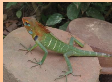
最後は綺麗な色のトカゲを発見！朝昼晩と黄色や緑に色が変わるそうです。