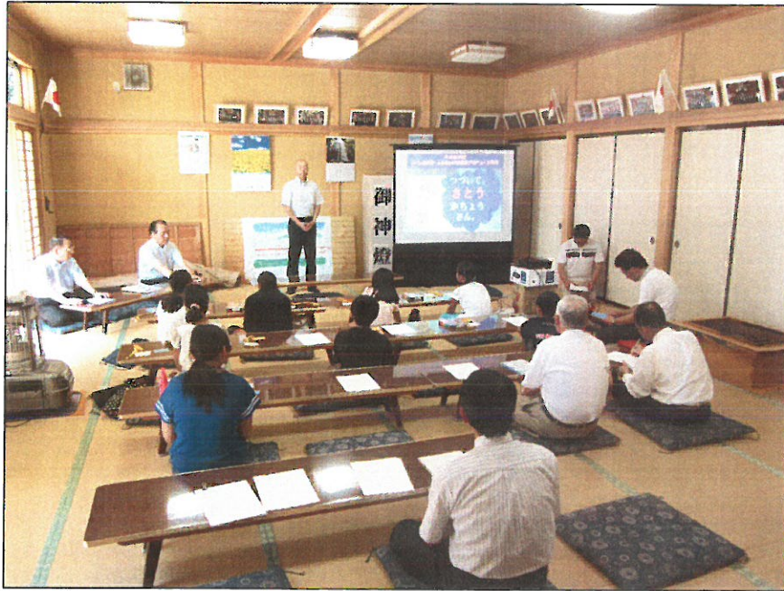
【開講式・ オリエンテーション】