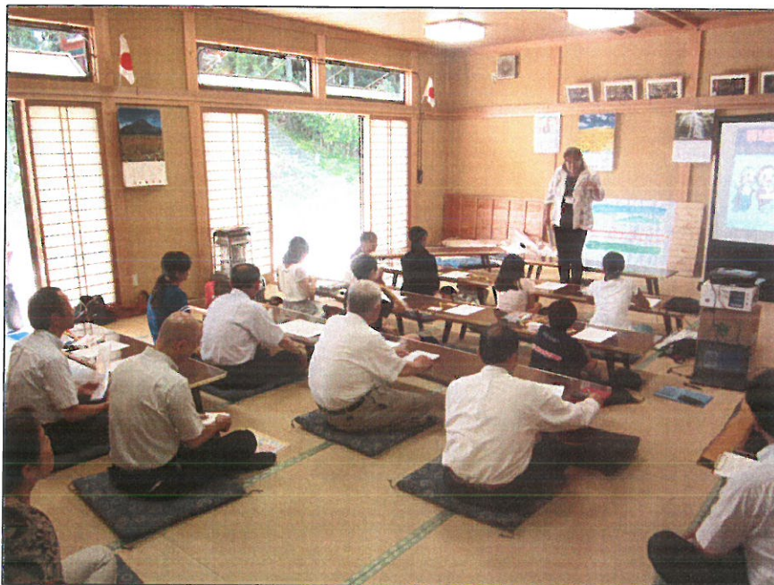
【まとめ・アンケート】 「先人から学ぶ」を聞いた感想、アンケート記入をしました。

常葉町の中心地にある「子松神社」の歴史、神社に係わるお祭り・伝承等についてお話をさせていただきました。