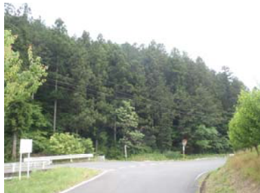
金沢地区里山再生プロジェクト（施工前）