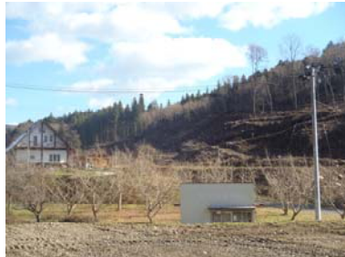
金沢地区里山再生プロジェクト（施工後）