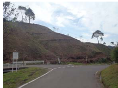
金沢地区里山再生プロジェクト（施工後）