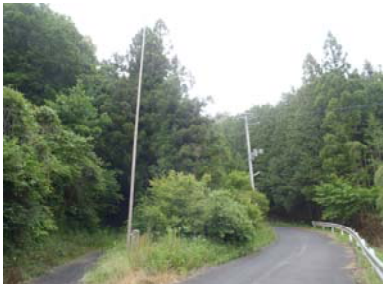
金沢地区里山再生プロジェクト (施工前)