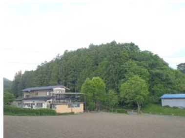
金沢地区里山再生プロジェクト（施工前）