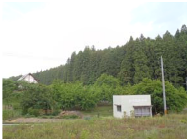
金沢地区里山再生プロジェクト（施工前）