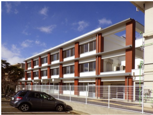
新校舎の外観（南西側から撮影）

当事務所 建築住宅課で施工監理を行っていた福島県立盲学校の新校舎が、2月7日（火）に完成し、児童・生徒の皆さんは2月13日（月）から新しい校舎で学校生活を送り始めました。