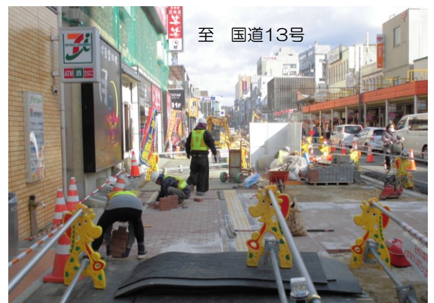
歩道ブロック設置中の施工状況（2月下旬撮影）

なお、「福島駅前通りリニューアル整備特設ページ」に掲載中の工事進捗状況より、施工区間や施工状況についてご確認いただけます。 http://www.pref.fukushima.lg.jp/sec/41310a/ekimaedorirenewal.html