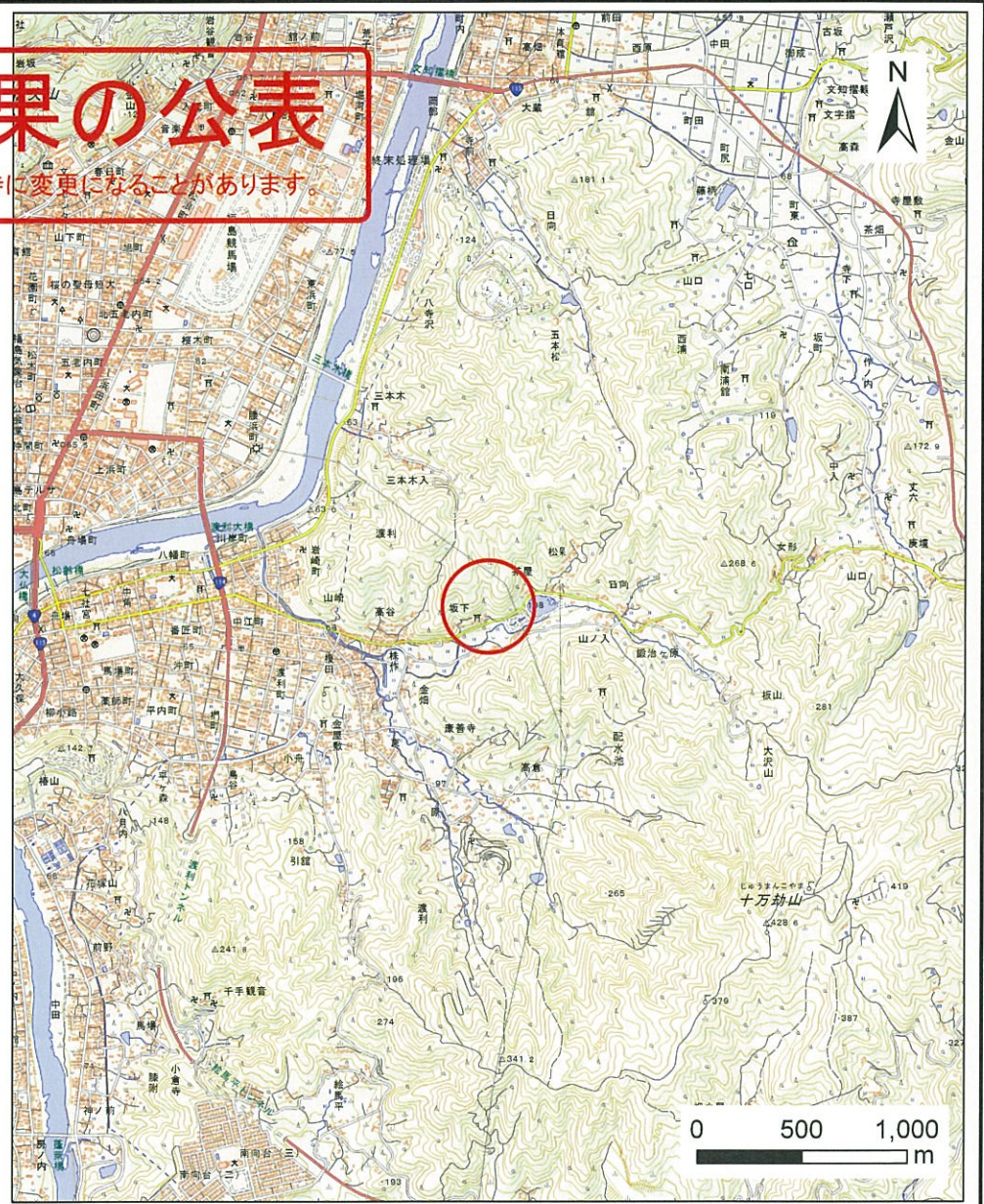
様式-1(土) 土砂災害警戒区域・土砂災害特別警戒区域 位置図