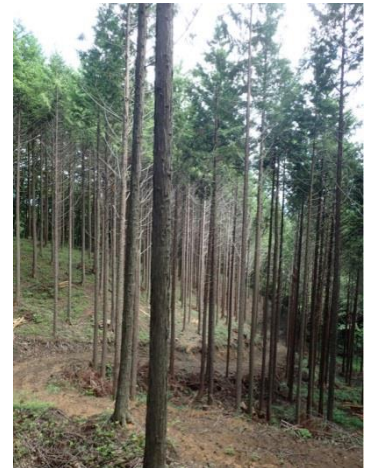
適正に間伐された ヒノキ人工林（三和町）