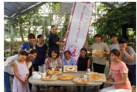
(農業女子ネットワーク会員の皆さん)

ふくしま農業女子ネットワークと県が主催し、いわき市好間の大和田自然農園を会場に、県内で活躍する女性農業者の活動を広く紹介するためのイベントを開催しました。ネットワーク会員など、県内の女性農業者15名がスタッフとして参加し、夏休み中の子どもや親子連れなどが訪れました。