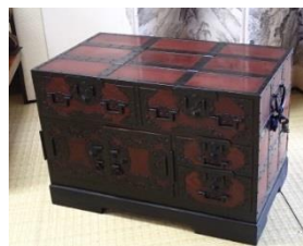
(受賞された赤津氏・船筆筥)