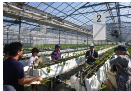
(生産者の経験談に興味津々！)

各生産者から作物の栽培状況や実際の農業経営、就農した経緯などの説明をいただき、参加者は熱気ムンムンで、生産者にたくさんの質問をしていました。また、選果場では、参加者全員リラックスして、サンシャインいわき梨の味を堪能しました。