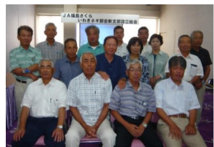
(設立総会にて、平北支部の皆さん)

これまで、神谷地区、草野地区にはそれぞれ支部が設置されていましたが、近年、特に神谷地区における部会員の高齢化や担い手不足、圃場の宅地化により、年々会員が減少していることから、隣接する草野地区と合併し、新たな支部を設けることになったものです。