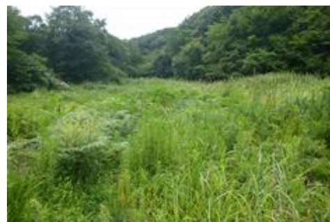
（作付けが行われていない農地）

なお、平成29年度より、農業委員会が毎年行っている農地の利用状況調査において、遊休農地 ※ と判断された土地を放置すると、固定資産税の課税が強化されることになりました。