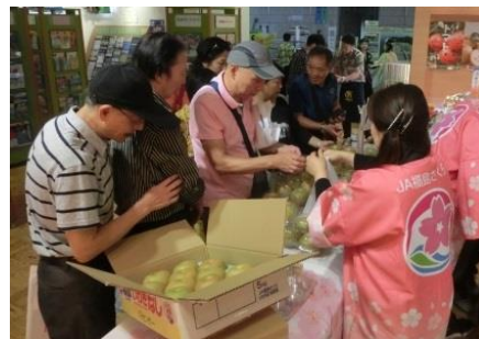
(大人気のサンシャインいわき梨)

物販ブースでは、JA 福島さくらが旬のサンシャインいわき梨やトマト、いわき産コシヒカリ「Iwaki Laiki」を販売したほか、いわき観光まちづくりビューローが「常磐もの」のかまぼこや6次化商品などを販売しました。特に、梨とトマト、かまぼこは完売となりました。外国人観光客からは、サンシャインいわき梨が大好評で、試食いただいた方からは笑顔がこぼれ、多くの方々に購入していただきました。秋から冬にかけての観光 PR、いわきファンの拡大を図ることができました。(いわき地方振興局)