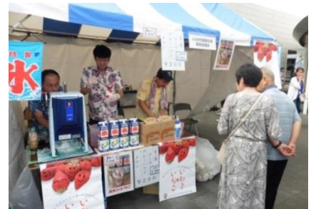
(いわき市産いちごを使ったかき氷が注目を集めました)

今後も、いわき市の魅力を多くの人に知ってもらえるよう、関係機関と連携し、県内外におけるPRを積極的に実施してまいります。(いわき地方振興局)