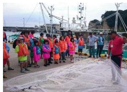
(漁業者による漁具説明)

体験メニューは、製氷工場見学、勿来漁港での漁船乗船・船びき網操業の見学でした。北茨城市大津港の製氷工場では、漁業に不可欠な氷の製造工程や冷凍庫を見学し、参加者は冷凍庫の大きさや内の寒さに驚いていました。漁船乗船、操業風景の見学では、4隻の漁船に参加者が分乗し、操業船1隻が船びき網を操業するのを間近で見学しました。