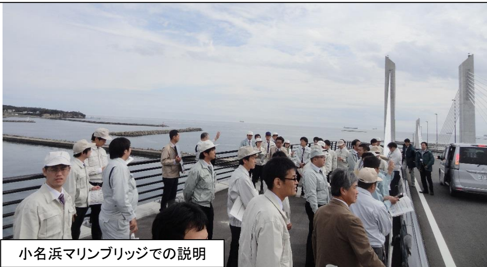
小名浜マリナブリッジでの説明

当所には、福島の復旧・復興のためH23年～H27年まで延べ16名の広島県からの派遣職員にご協力頂きました。今回の調査で、その内5名がいらしており、復旧が進んだ様子を見て、福島の復興を実感していました。