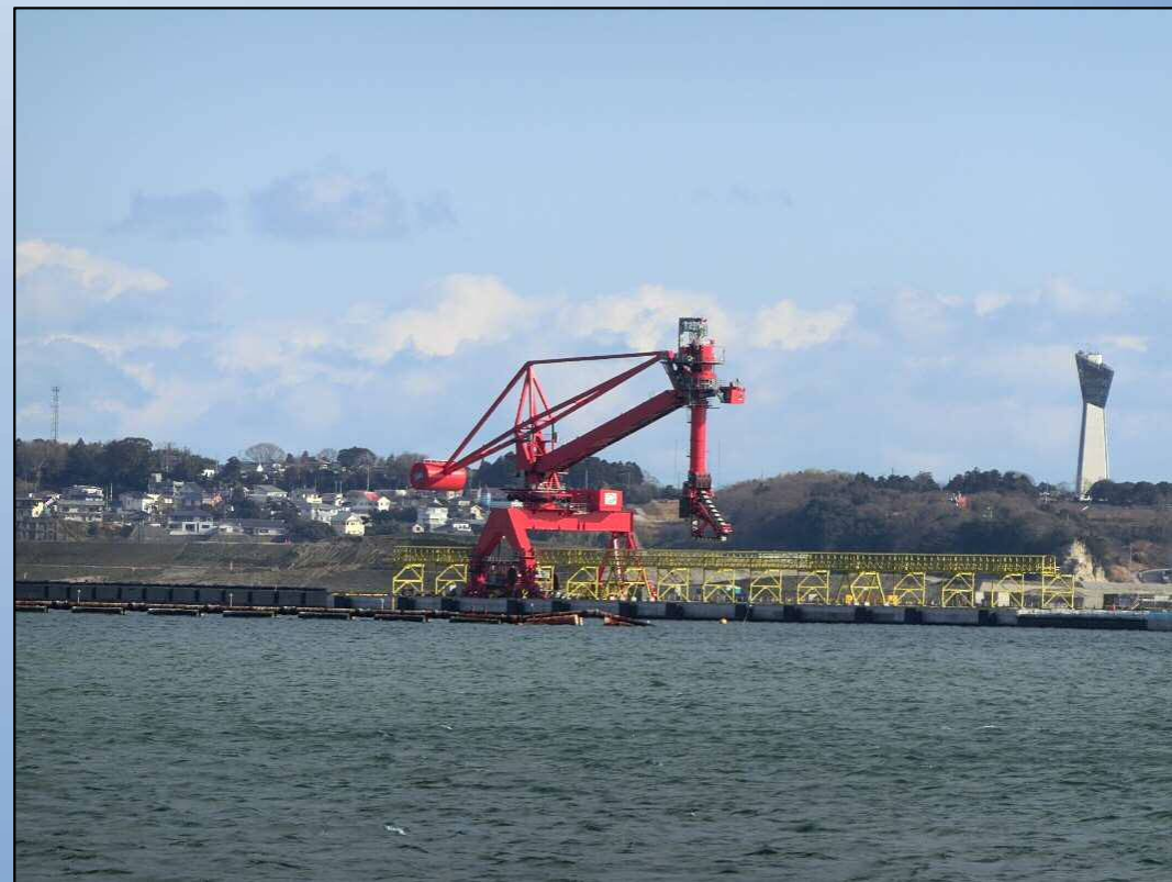
アンローダーの全景(大剣ふ頭から)