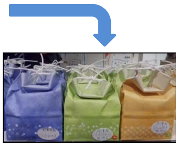
<企業内マルシェの様子>