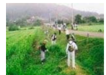
農地法面の草刈り