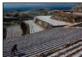
石積みのある超急傾斜地

超急傾斜地（田:1/10以上、畑:20度以上）の農用地について、その保全や有効活用に取り組む集落を支援 ※ 平成29年度より、【集落協定等に基づく活動】の①のみで加算が受けられるよう要件を緩和