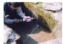
水路のひび割れ補修