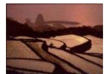
中山間地域 (山口県長門市)

中山間地域等において、農業生産条件の不利を補正することにより、将来に向けて農業生産活動を維持するための活動を支援