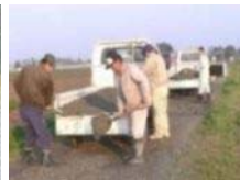
農地法面の草刈り