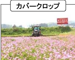
5割低減の取組の前後のいずれかにカバークロップの作付けや堆肥を施用する取組