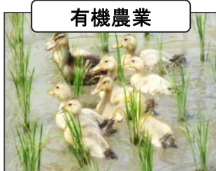
化学肥料・化学合成農薬を使用しない取組

農業者の組織する団体等は、左記の対象取組に加え、自然環境の保全に資する農業生産活動を推進するための活動（技術向上や理解促進に係る活動等）を実施