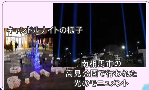
キャンドルナイトの様子