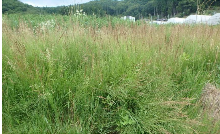
図1 クリーピングベントグラス