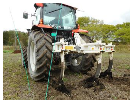
図2 リッパ装着時のトラクター(出力 99kW)