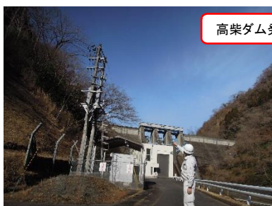
高柴ダム発電施設点検