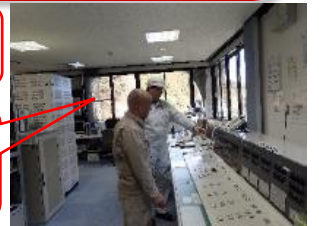
問題箇所はないか!? 前当直者と綿密な引継ぎ