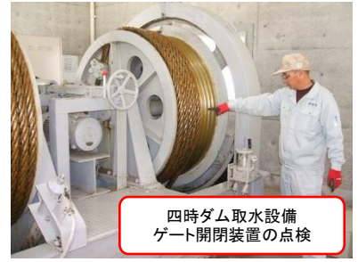
四時ダム取水設備 ゲート開閉装置の点検