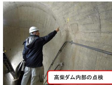
高柴ダム内部の点検