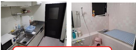
ダム管理所にはキッチン・浴室完備 「腹が減っては戦が出来ず」と 「心身の骨休め」