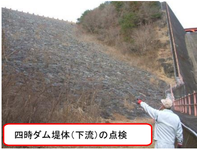
四時ダム堤体(下流)の点検