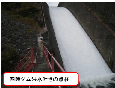
四時ダム洪水吐きの点検