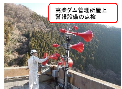
高柴ダム管理所屋上警報設備の点検