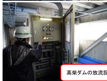
高柴ダムの放流設備(ゲート)点検