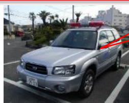
パトロール車でいざ出発!!

この他、大雨による洪水時や地震発生時には昼夜問わず、臨時巡視点検を行うとともに、ダムから下流に放流する際は、事前に川の中に人が残されていないか等の安全確保のためパトロールを行っています。また、ダム本体のみならず、遠方にある雨量観測設備やダム下流にある警報設備も点検を定期的に行っています。