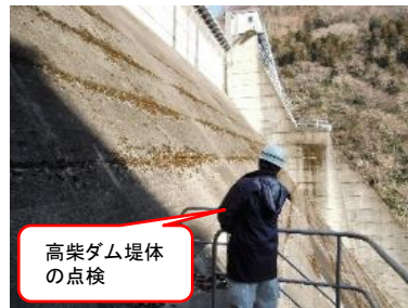
高柴ダム堤体の点検