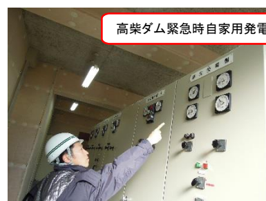
高柴ダム緊急時自家用発電点検