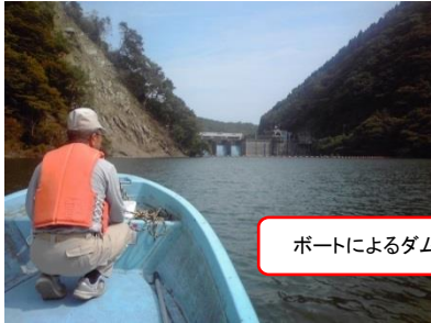
ボートによるダム湖巡視