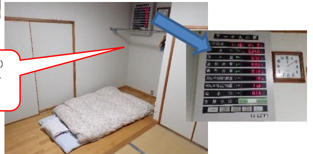
宿直室での仮眠(0:00~4:30) 頭上にデータ表示板があり、 異常発生時にはアラームが 鳴り響く