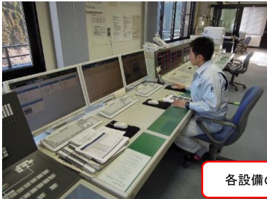
各設備の遠隔監視操作