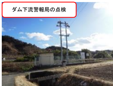
ダム下流警報局の点検