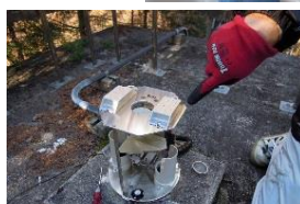
気象観測装置(雨量計)の点検