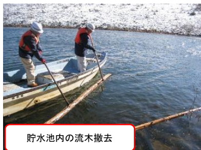
貯水池内の流木撤去