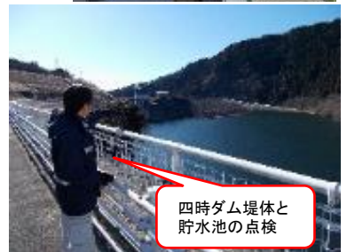
四時ダム堤体と貯水池の点検