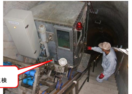
四時ダム監査廊 昇降設備による点検