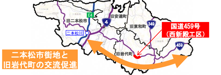
二本松市街地と旧岩代町の交流促進