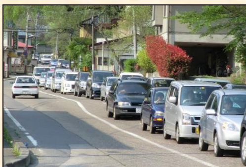
道路交通が集中し渋滞が頻発

市内での安全な通勤・通学や日常生活での利便性確保、観光客を招き入れての地域活性化、広域的で安定した物流などを実現するため、歴史ある街道筋を残しつつ新たな白河市内の骨格をなす道路として、白河市を南北に縦断する国道294号白河バイパスを平成30年代前半の供用開始を目指し整備しています。