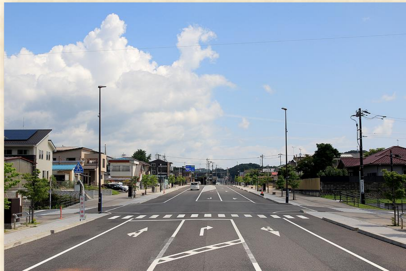
馬町工区(平成25年度供用開始)