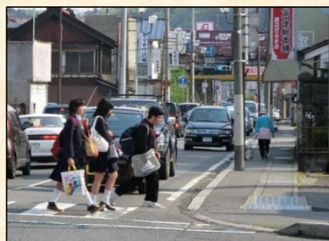
道幅が狭く歩行空間が不十分